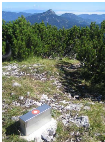
Vrh Velikega vrha