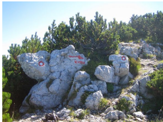
Na vršnem grebenu